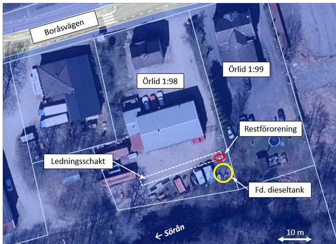
Figur 2. Översiktsbild som visar vart dieseltanken tidigare stått på fastigheten.