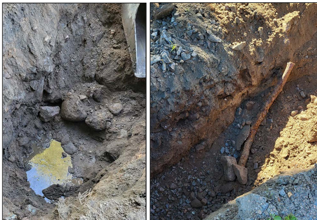
Figur 4. Schaktgrop med grus- och stenfyllning ner till grundvatten (vänster) samt grop där järnledning påträffades (höger).