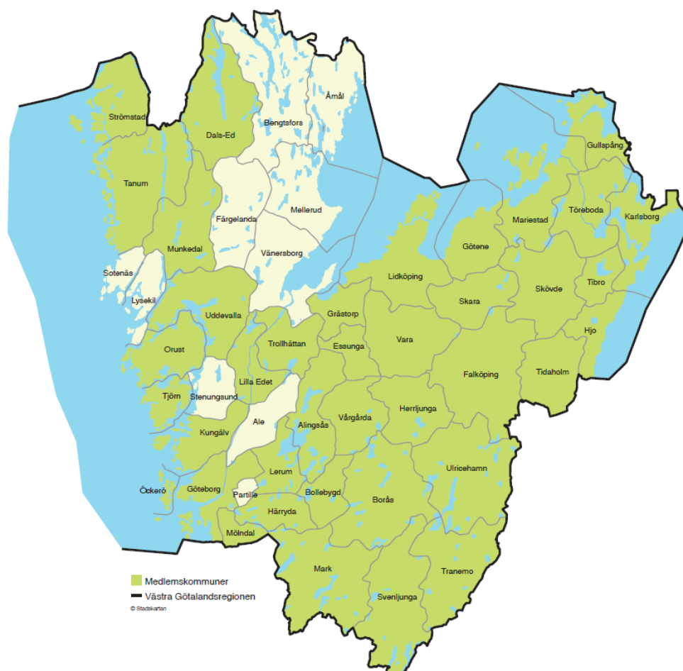
Figur 1 Karta över medlemsorganisationerna

Tolkförmedling Väst har varit i drift sedan 1 april 2013 och bildades av Västra Götalandsregionen, Göteborgs Stad, samt kommunerna Borås, Mariestad, Trollhättan och Uddevalla. I januari 2015 utökades förbundet med 28 nya medlemskommuner. Ytterligare 12 nya medlemskommuner tillkom januari 2019. Förbundet består nu av totalt 40 medlemmar; Västra Götalandsregionen samt kommunerna Alingsås, Borås, Bollebygd, Dals-Ed, Essunga, Falköping, Grästorp, Gullspång, Göteborg, Götene, Herrljunga, Hjo, Härryda, Karlsborg, Kungälv, Lerum, Lidköping, Lilla Edet, Mariestad, Mark, Munkedal, Mölndal, Orust, Skara, Skövde, Strömstad, Svenljunga, Tanum, Tibro, Tidaholm, Tjörn, Tranemo, Trollhättan, Töreboda, Uddevalla, Ulricehamn, Vara, Vårgårda och Öckerö.