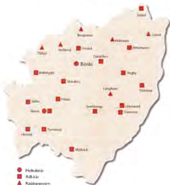
Förbundets geografi med stationernas spridning i de sex kommunerna som utgör SÄRF.

Södra Älvsborgs Räddningstjänstförbund (SÄRF) är ett kommunalförbund som organiserar och ansvarar för räddningstjänsten i sex kommuner: Bollebygd, Borås, Mark, Svenljunga, Tranemo och Ulricehamn. Vi har 24 brandstationer som är fördelade i samtliga medlemskommuner varav två stationer med heltidsanställd räddningspersonal, 17 stationer med räddningstjänstpersonal i beredskap (RiB) och sex räddningsvårn (frivilliga). Antalet anställda uppgår till cirka 500, varav huvuddelen är hel- eller deltidsanställd räddningstjänstpersonal. Vårt huvudkontor finns i Borås där förbundets övningsanläggning också finns invid Guttasjön.