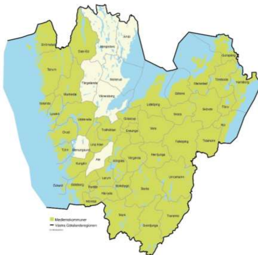
Figur 1 Karta medlemmar

Tolkförmedling Väst har varit i drift sedan 1 april 2013 och har totalt 43 medlemmar; Västra Götalandsregionen samt kommunerna Alingsås, Borås, Bollebygd, Dals-Ed, Essunga, Falköping, Grästorps, Gullspång, Göteborg, Götene, Herrljunga, Hjo, Härryda, Karlsborg, Kungälv, Lerum, Lidköping, Lilla Edet, Lysekil, Mariestad, Mark, Munkedal, Mölndal, Orust, Partille, Skara, Skövde, Sotenäs, Strömstad, Svenljunga, Tanum, Tibro, Tidaholm, Tjörn, Tranemo, Trollhättan, Töreboda, Uddevalla, Ulricehamn, Vara, Vårgårda och Öckerö.