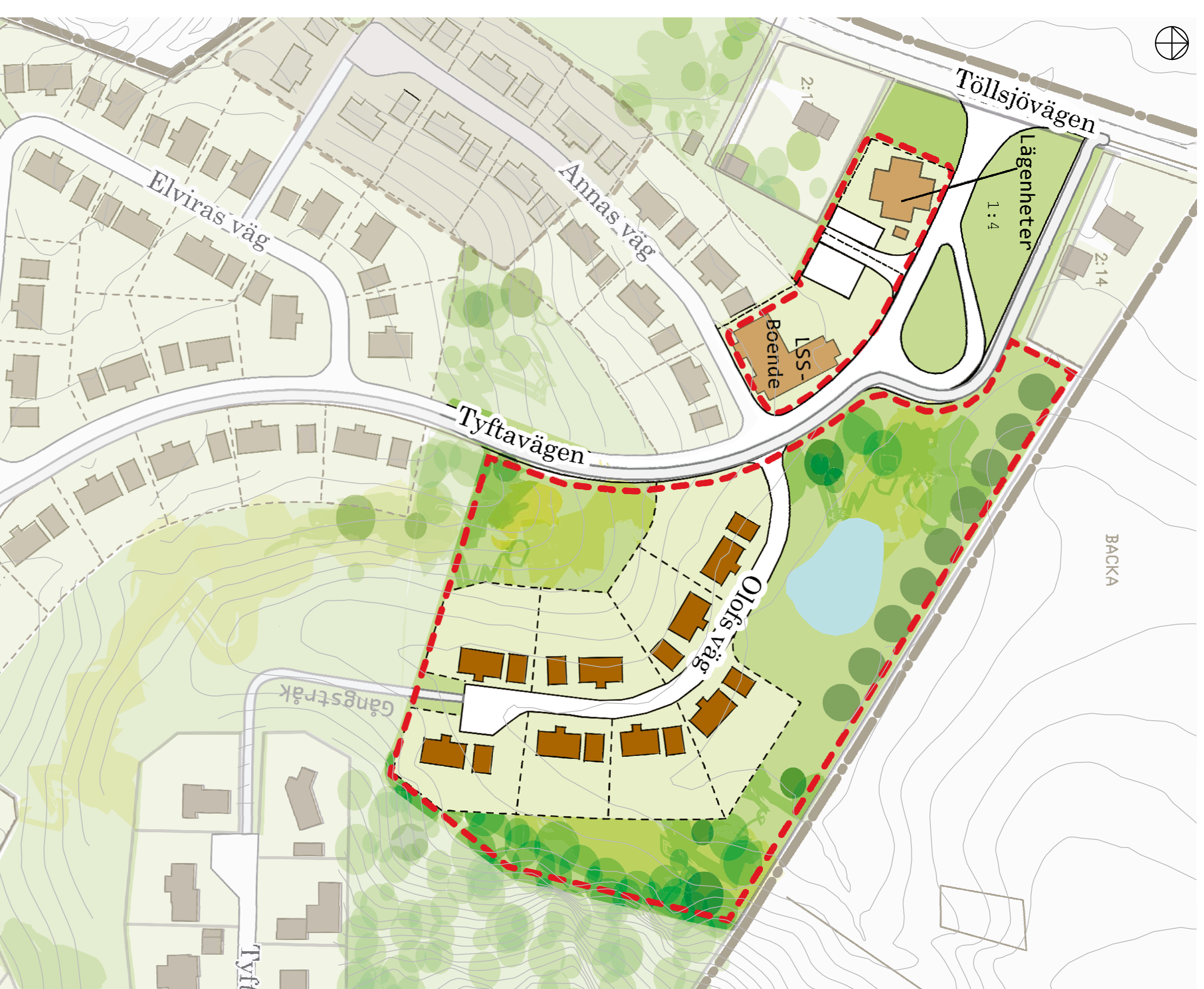
ILLUSTRATION (illustrationskartan är inte juridiskt bindande, utan visar endast exempel på planförslagets utbyggnad)