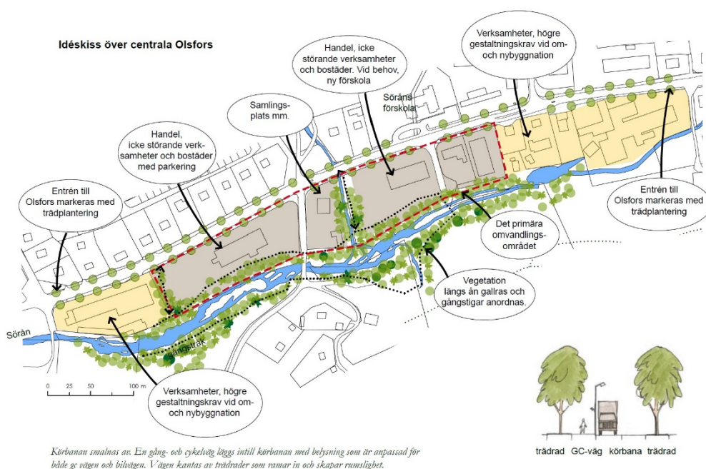
Figur 3. Omvandlingsmöjligheter i Olsfors