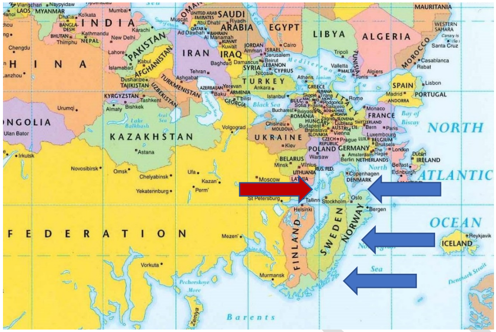
Bilden illustrerar olika tänkta förbindelser och flöden till Sveriges strategiskt viktiga områden.