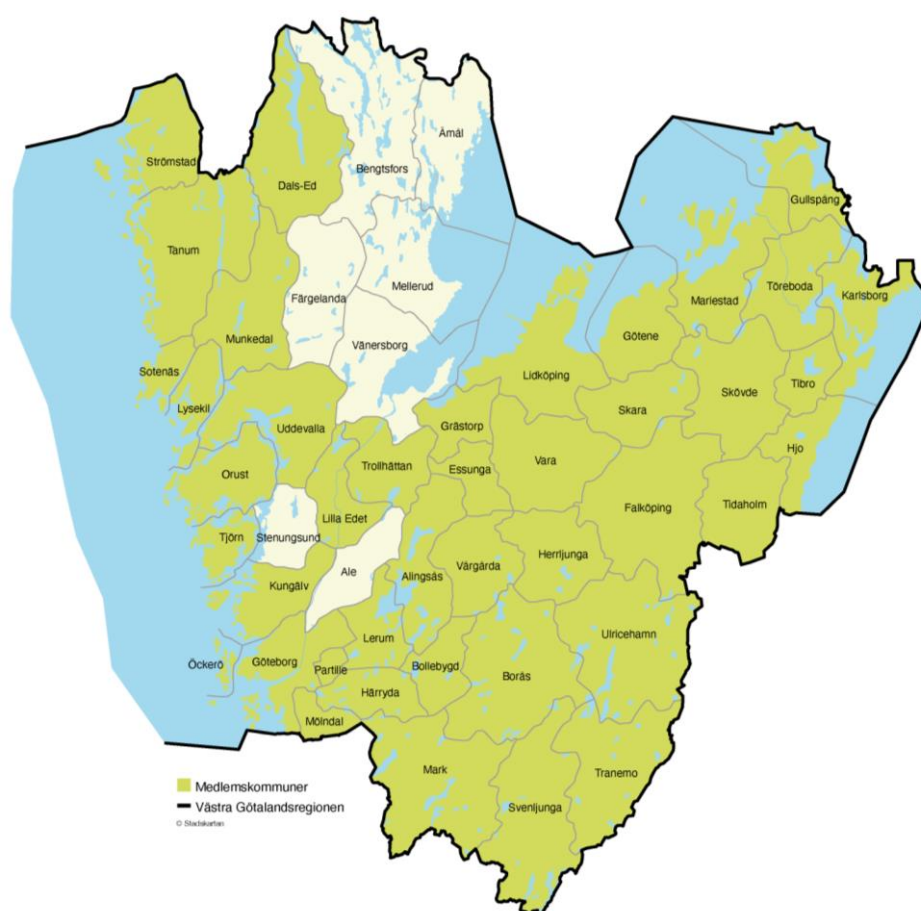
Figur 1 Karta över medlemskommuner

Tolkförmedling Väst har varit i drift sedan 1 april 2013 och består av totalt 43 medlemmar; Västra Götalandsregionen samt kommunerna Alingsås, Bollebygd, Borås, Dals-Ed, Essunga, Falköping, Grästorp, Gullspång, Göteborg, Götene, Herrljunga, Hjo, Härryda, Karlsborg, Kungälv, Lerum, Lidköping, Lilla Edet, Lysekil, Mariestad, Mark, Munkedal, Mölndal, Orust, Partille, Skara, Skövde, Sotenäs, Strömstad, Svenljunga, Tanum, Tibro, Tidaholm, Tjörn, Tranemo, Trollhättan, Töreboda, Uddevalla, Ulricehamn, Vara, Vårgårda och Öckerö.