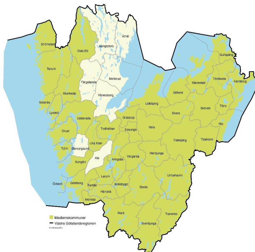
Figur 1 Karta medlemmar

Tolkförmedling Väst har varit i drift sedan 1 april 2013 och har totalt 43 medlemmar; Västra Götalandsregionen samt kommunerna Alingsås, Borås, Bollebygd, Dals-Ed, Essunga, Falköping, Grästorp, Gullspång, Göteborg, Götene, Herrljunga, Hjo, Härryda, Karlsborg, Kungälv, Lerum, Lidköping, Lilla Edet, Lysekil, Mariestad, Mark, Munkedal, Mölndal, Orust, Partille, Skara, Skövde, Sotenäs, Strömstad, Svenljunga, Tanum, Tibro, Tidaholm, Tjörn, Tranemo, Trollhättan, Töreboda, Uddevalla, Ulricehamn, Vara, Vårgårda och Öckerö.